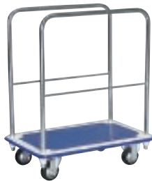
SI (C) - CW