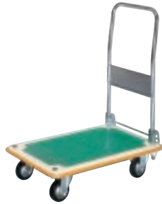
SA (B) - CW