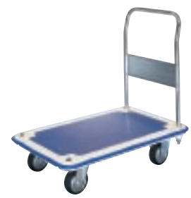
MB (C) - CW