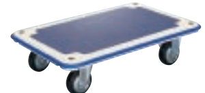
MR (C) - CW