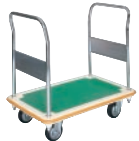
MC (B) - CW