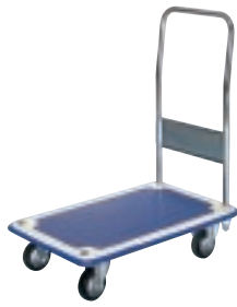
SB (C) - CW