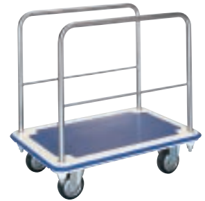
MI (C) - CW