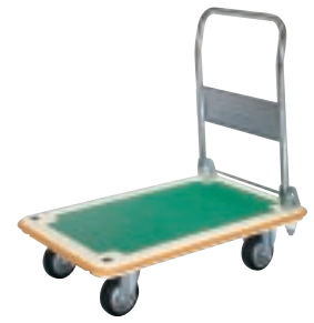
MA (B) - CW