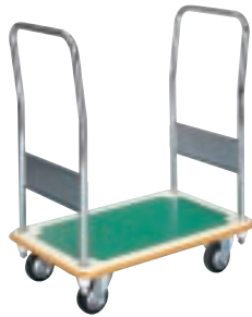
SC (B) - CW