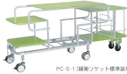
PC-S-1（緩衝ソケット標準装着）