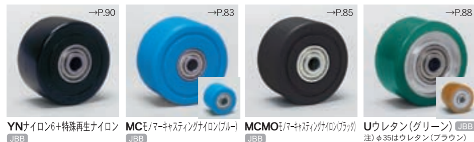
YNナイロン6+特殊再生ナイロン JBB MCモ/マキアスティングナイロン(ブルー) JBB MCMOモ/マキアスティングナイロン(ブラック) JBB Uウレタン(グリーン) JBB 注)φ35はウレタン(ブラウン)