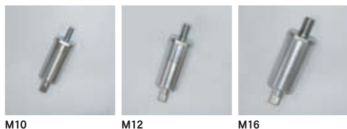
M10 M12 M16