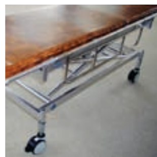
ストレッチャーでの使用例 (LGDA-PUA G(P.71)との組合せ例 SA-SO M12)