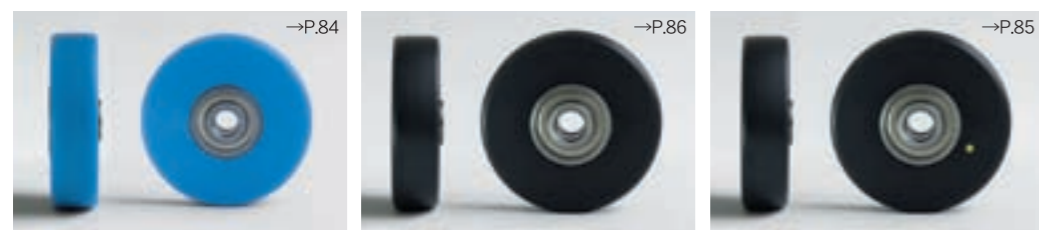
MCモノマーキャスティングナイロン(ブルー) SJB →P.84 MCMOモノマーキャスティングナイロン(ブラック) SJB →P.86 MCD導電性MCナイロン(ブラック) SJB →P.85 ●体積固有抵抗値 10 2 ~10 4 Ω・cm* (*材料メーカー測定値で保証値ではありません。)