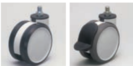
(LGDA用) PYA Gナイロン(ナイロン6) ●ベアリングなし (LGDA用) PUA Gウレタン ●ベアリングなし