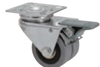
後方ペダルストッパー LDA-VPA50K-FI (旋回・車輪回転を同時に止めるダブルストッパー)