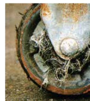
ก่อนที่จะเป็นแบบนี้ !