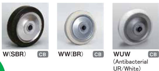
W(SBR) CB WW(BR) CB WUW (Antibacterial UR/White) CB

CB ... Pressed bearing (with plastic shield) W-75,W-100: not available JBB ... Radial ball bearing