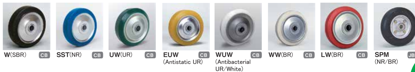
W(SBR) CB SST(NR) CB UW(UR) CB EUW (Antistatic UR) CB WUW (Antibacterial UR/White) CB WW(BR) CB LW(BR) CB SPM (NR/BR) JBB

CB ... Pressed bearing (with plastic shield) W-75,W-100: not available JBB ... Radial ball bearing