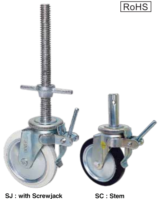
SJ : with Screwjack