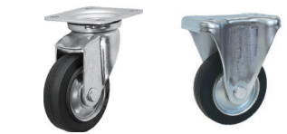
自在旋回 固定 DSA WJ-100 WK-100