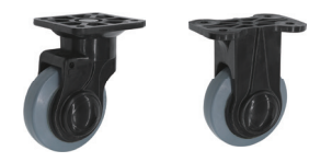
自在旋回 固定 DSA RP-CO-100 RP-CW-100