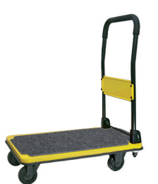
DSA (BYE)-BKW イエロー