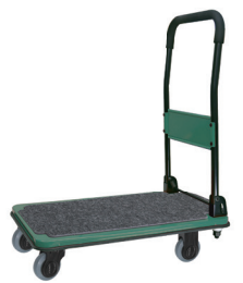
DSA (BGR)-RP グリーン