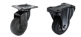
自在旋回 固定 DSA BKWJ-100 BKWK-100