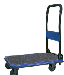
DSA (BNV)-BKW ネイビー