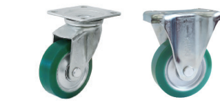
自在旋回 固定 DSA UWJ-100 UWK-100