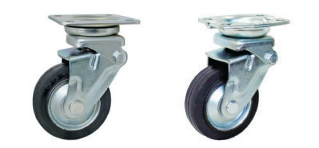
自在旋回 固定 DSA SAJ-100W SAK-100W