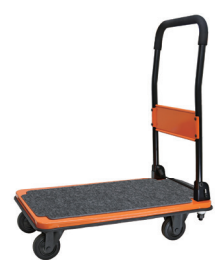
DSA (BOR)-BKW オレンジ