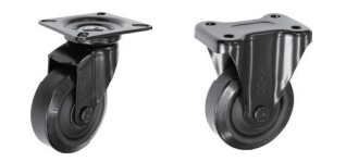
自在旋回 固定 DSA BKUWJ-100 BKUWK-100