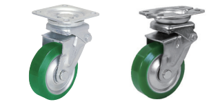
自在旋回 固定 DSA SAJ-100UW SAK-100UW