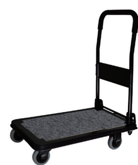
DSA (BBK)-RP 静音キャスタブラック