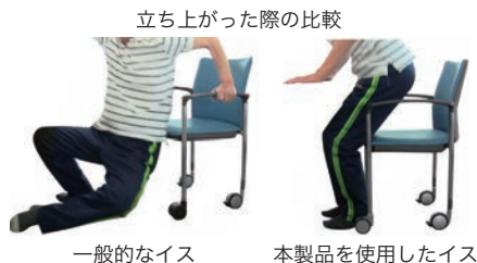
立ち上がった際の比較