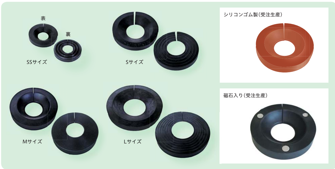
シリコンゴム製(受注生産)